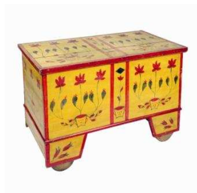
Skrzynia wianna, Szczebrzeszyn, pow. zamojski, woj. lubelskie; wyk. Spul Gacel, I połowa XX wieku

Każdy otrzyma również bezpłatny miniprzewodnik.