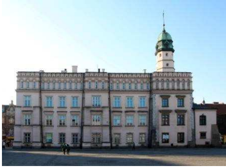
Muzeum Etnograficzne - Ratusz

Ekspozycja: Muzeum Etnograficzne im. Seweryna Udzieli w Krakowie - Ratusz (pl. Wolnica 1)