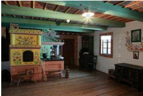
Izba krakowska

W salach wystawowych przygotowanych zgodnie z ideą skansenu w centrum miasta zobaczymy izbę krakowską, której ściany, powała i piec pomalowane są w zalipiańskie kwiaty. Meble pochodzą z małopolskich ośrodków stolarstwa. Obrazy z wizerunkami świętych to pamiątki przywożone z pielgrzymek lub zakupione u wędrownych handlarzy. Wiejskie budownictwo Krakowiaków ukazuje model chałupy Błażeja Czepca z Bronowic, wykonany przed stu laty pod kierunkiem Włodzimierza Tetmajera.