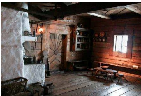
Izba podhalańska